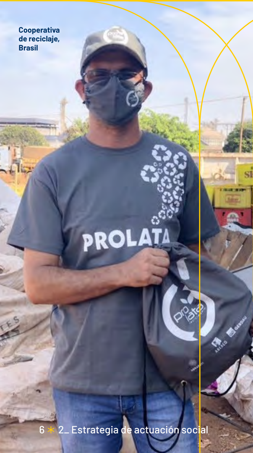
Cooperativa de reciclaje, Brasil

La estrategia de actuación de Gerdau en el ámbito social está dirigida al espíritu emprendedor centrado en tres pilares: educación, reciclaje y vivienda. La empresa brinda apoyo técnico, financiero y de voluntariado a personas y organizaciones, para que sean capaces de transformarse a sí mismas y a su entorno, generando cambios positivos en las comunidades.