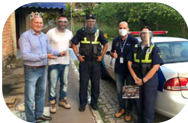
Donaciones en Charqueadas (Brasil)

➔ Gerdau donó más de 200.000 EPI —entre mascarillas, guantes, cofias, pantallas faciales, overoles y anteojos— a organizaciones de salud y seguridad pública en todos los países donde opera, beneficiando a profesionales como médicos y enfermeras, paramédicos, bomberos y policías.