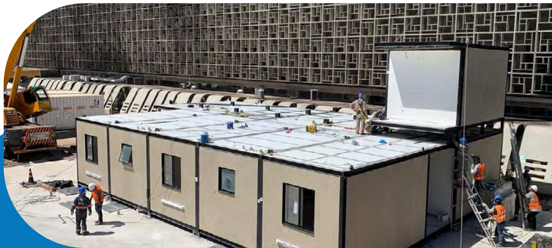
El acero es la principal materia en la técnica de construcción modular de Brasil ao Cubo