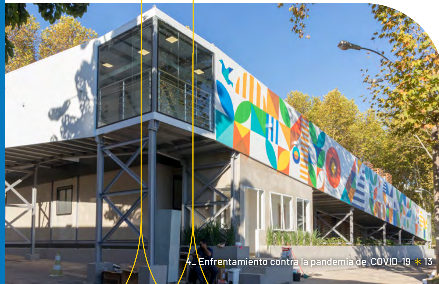
Centro de Tratamiento de lucha contra la COVID-19 en Porto Alegre (Brasil)

Se construyeron dos hospitales, uno en Sao Paulo y otro en Porto Alegre. El proyecto se realizó en colaboración con otras instituciones ( ver más en el recuadro ) y Brasil ao Cubo, empresa de construcción modular en estructuras metálicas, lo ejecutó en tiempo récord. Además de los dos nuevos hospitales construidos, se reformaron otros ocho: siete en Brasil y uno en Argentina.