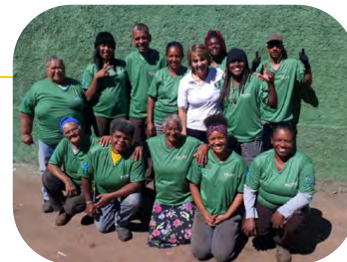
Recolectores de material reciclable en Brasil

➔ Donación de más de 13.000 canastas básicas de alimentos y kits de higiene en Brasil, en colaboración con UNICEF y el Fondo Social de São Paulo (Brasil).