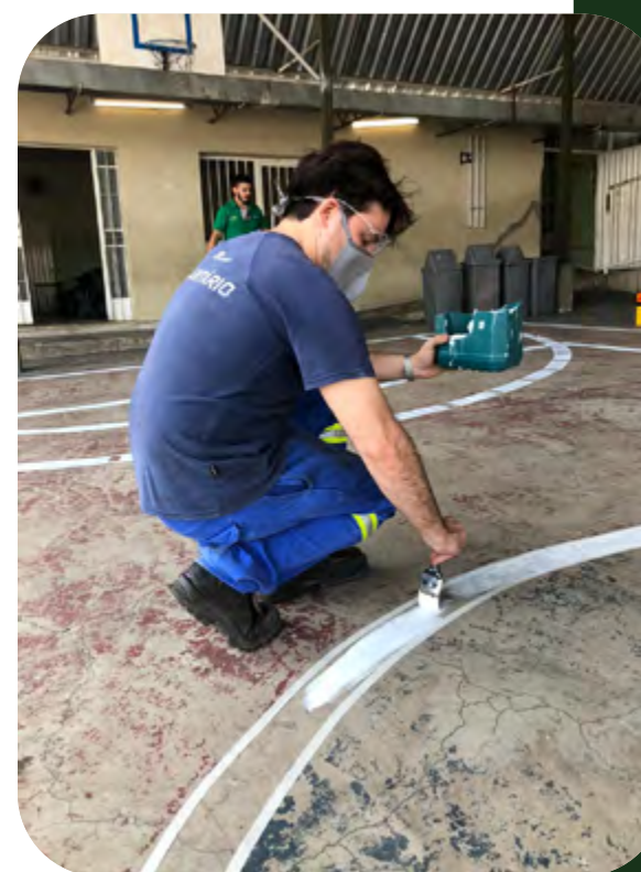
Proyecto 5S en las escuelas

Liderazgo Digital - proyecto desarrollado por el equipo de voluntarios de Gerdau en Perú consistente en sesiones de mentoría, donde los voluntarios comparten con los alumnos contenidos sobre liderazgo, autoconocimiento, ética y propósito, entre otros. Este proyecto se realizó con los alumnos de la escuela técnica de Chimbote, organización apoyada desde 2006.