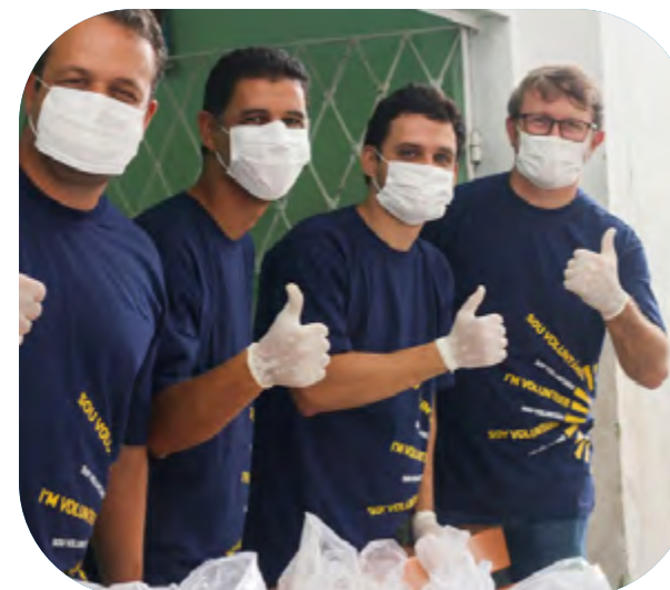
Donación de canastas de alimentos en Recife (Brasil)

➔ Donación de más de 13.000 canastas básicas de alimentos y kits de higiene en Brasil, en colaboración con UNICEF y el Fondo Social de São Paulo (Brasil).