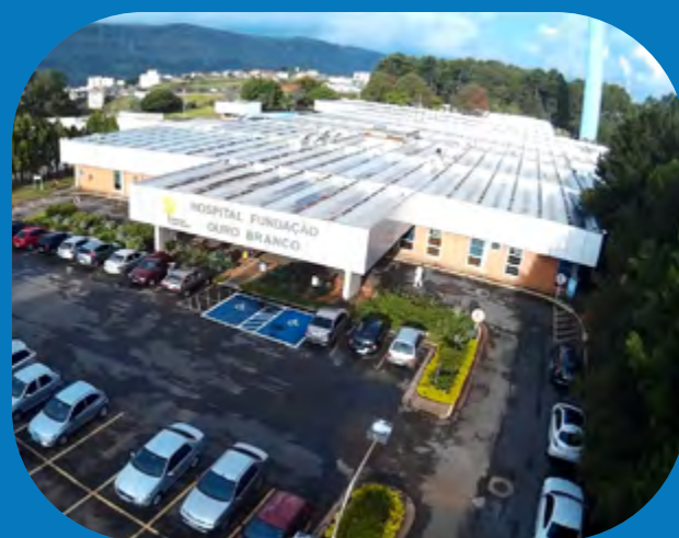
El Hospital Fundación Ouro Branco recibió nuevos equipos y camas

mejorar las estructuras hospitalarias, aumentar y mejorar las camas para la atención de pacientes con COVID-19, donar equipos de protección individual (EPI) y donar alimentos y kits de higiene, tan importantes para minimizar la propagación del virus y fundamentales para brindar una asistencia social a las familias en situación de vulnerabilidad social. Además, hubo participación en fondos que apoyan a emprendedores, así como a otros segmentos, que sufrieron los impactos económicos de la pandemia.