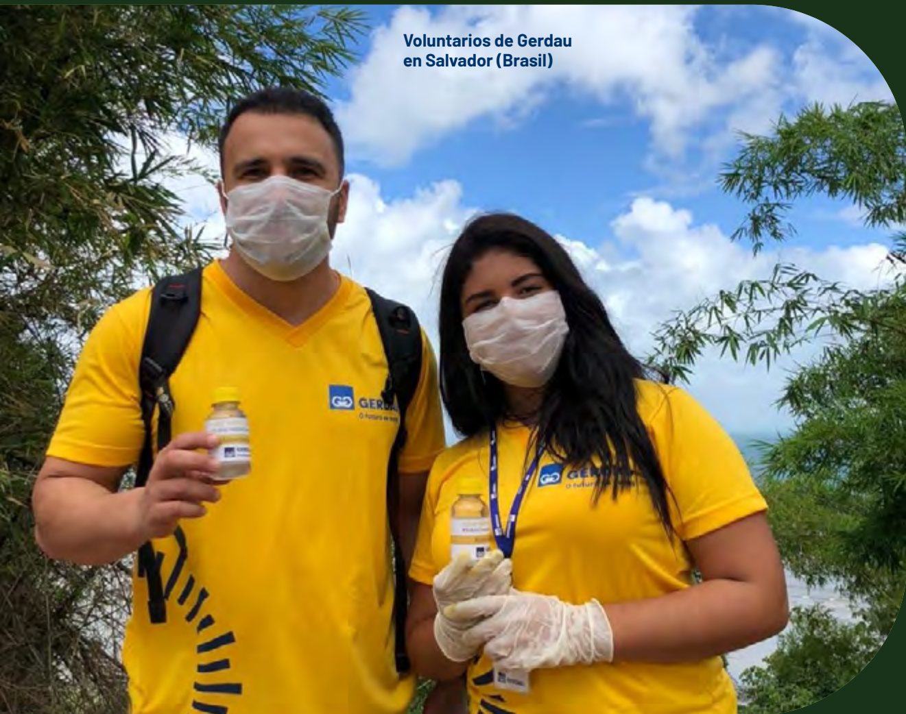
Voluntarios de Gerdau en Salvador (Brasil)

comunidades, es una de las formas con las que Gerdau contribuye a que haya una mayor igualdad de oportunidades, buscando materializar su propósito de empoderar personas que construyen el futuro.