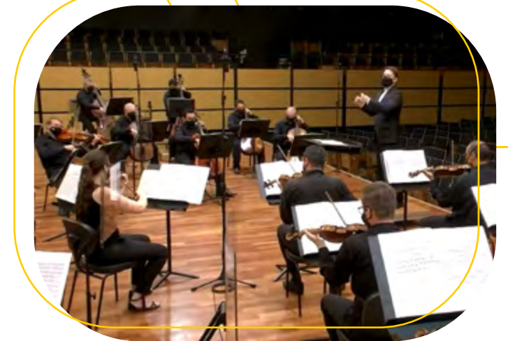
Orquesta Sinfónica de Porto Alegre

“La sorpresa de la pandemia nos trajo un año de muchas dificultades e incertidumbres. Surgió un nuevo desafío y la adaptación se hizo inevitable. La Ospa logró, dentro de las limitaciones que el momento exigía, mantener su programación con la realización de 34 conciertos online. También se podrá mantener la construcción del Complejo Casa de la Ospa, patrocinada por Gerdau. Así, a pesar de este año difícil, fue posible llevar a cabo algunos avances. Para 2021, el deseo es que la humanidad pueda volver a la normalidad con salud, y que la Ospa, paulatinamente, amplíe sus actividades, llevando la música clásica a toda la sociedad.”