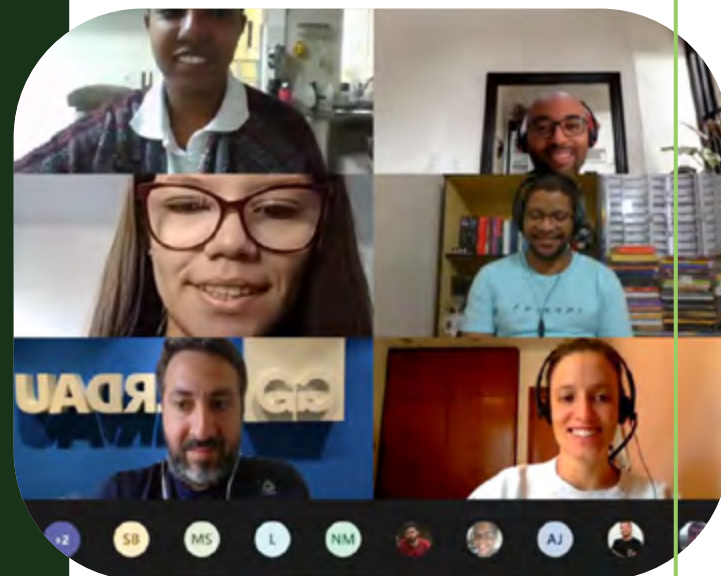
Proyecto Start Gerdau

“Quiero agradecer la oportunidad de participar como voluntaria. En mi caso, es el segundo año que participo, y en 2020 formé parte del proyecto de Junior Achievement. Crecí mucho como persona y espero que cada año participe más gente en el proyecto. No nos sobra mucho tiempo, ¡pero podemos dedicar algunos minutos de nuestro día para preparar una clase u otras actividades de voluntariado!”