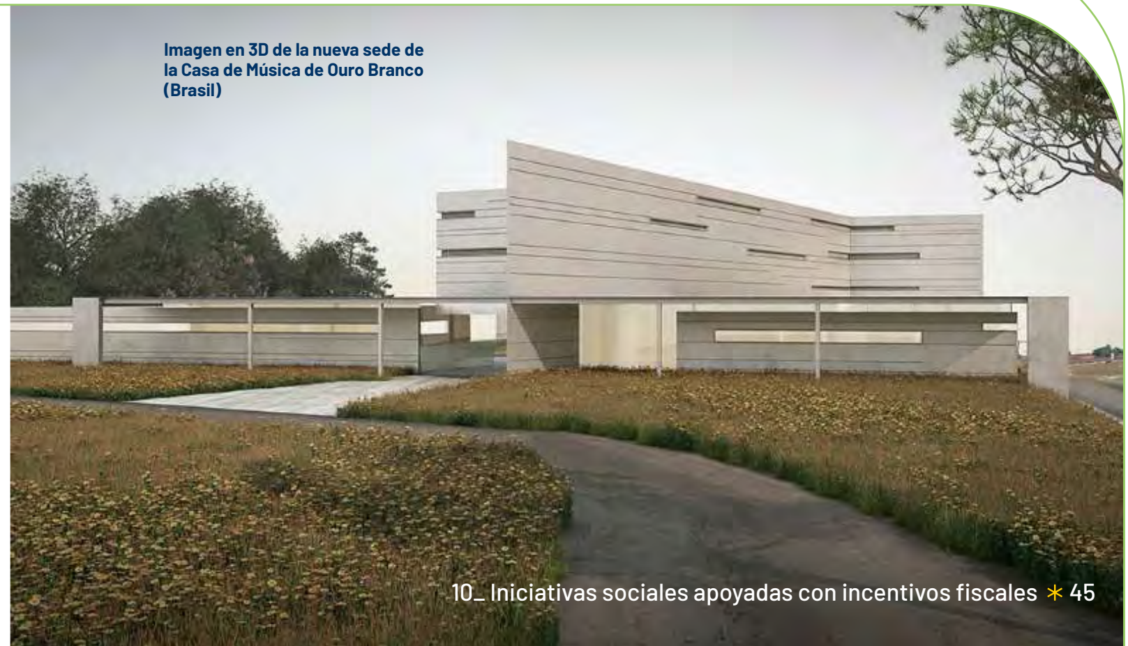
Imagen en 3D de la nueva sede de la Casa de Música de Ouro Branco (Brasil)