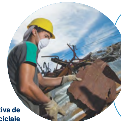
Cooperativa de Reciclaje