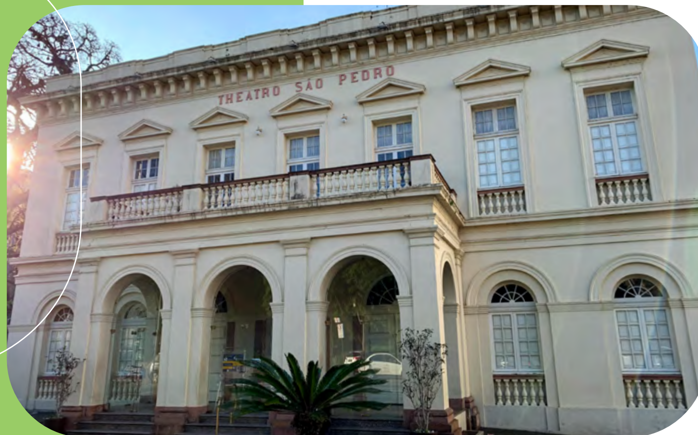
Theatro São Pedro (Brasil)

Hay leyes vigentes para proyectos en las áreas de cultura, deporte y salud, además de fondos para personas mayores y para niños y adolescentes. Con el uso de estos incentivos fiscales en Brasil, Gerdau aumenta el presupuesto destinado a las acciones en las comunidades donde está presente. Conozca algunas de las iniciativas apoyadas: