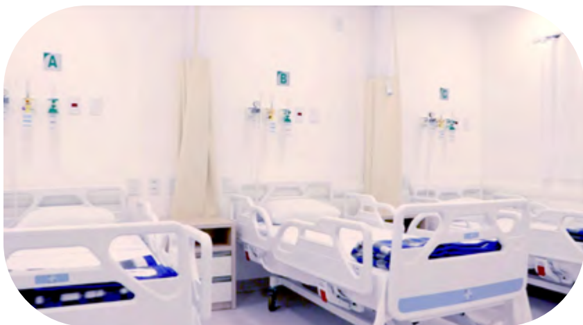
Centro de Tratamiento de la COVID-19 en Porto Alegre (Brasil)